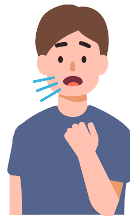
Batuk berterusan selama 3 minggu atau lebih lama