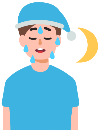
Berpeluh Pada Sebelah Malam