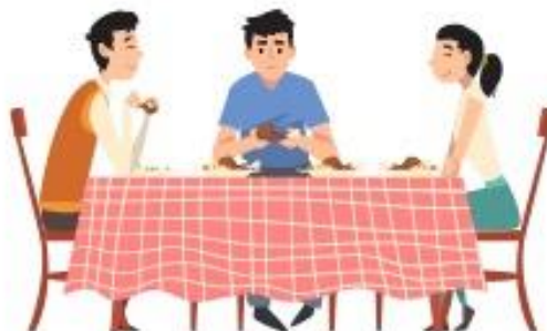
Berkongsi makanan atau minuman