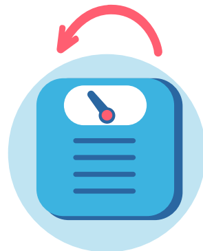
Penurunan Berat Badan