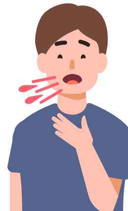
Darah dalam Kahak