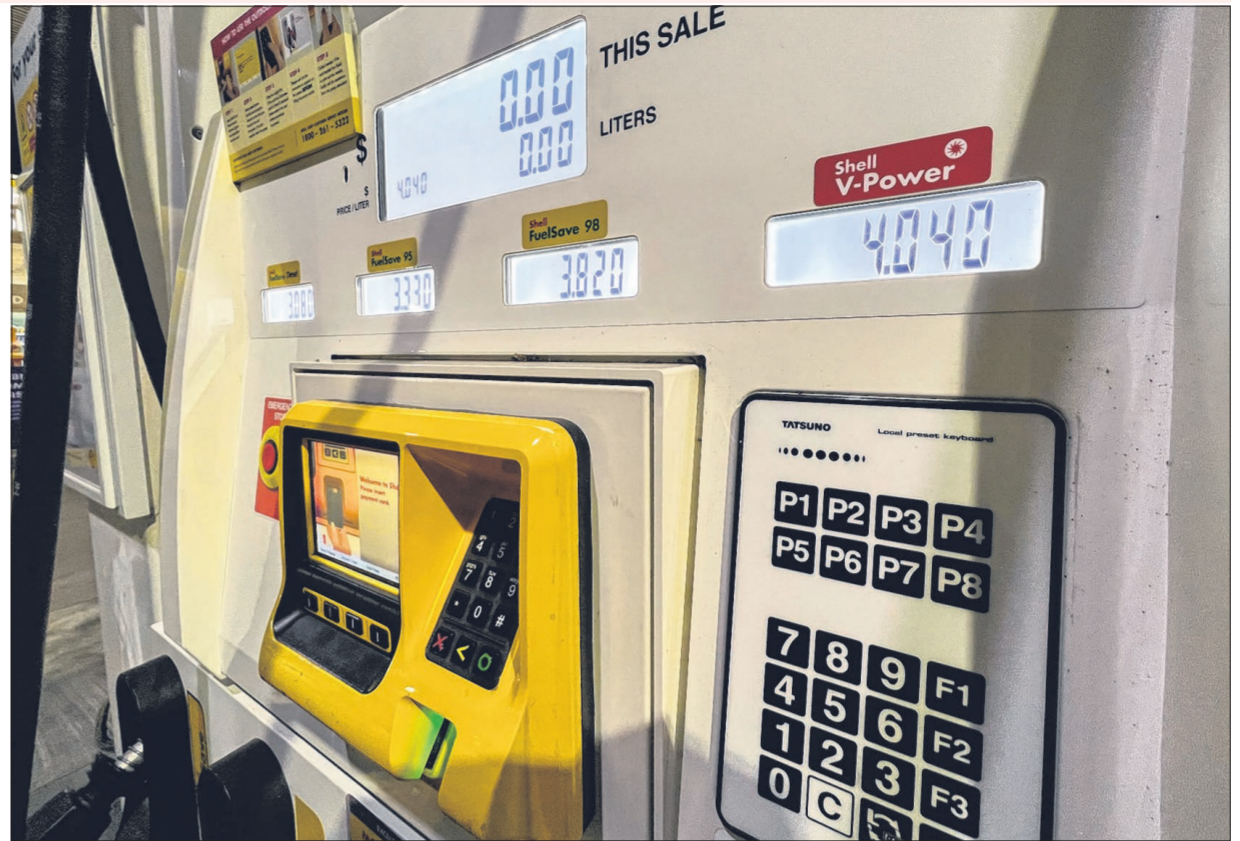
价格最高的特98辛烷值(98-octane)售价升破4元。在蚬壳油站, V-Power汽油已涨至每公升4元零4分。

私车司机谢先生(38岁)告诉记者, 为了偿还车贷, 他每天须至少入账35元, 即每天须行车至少约两小时。若没有20%的