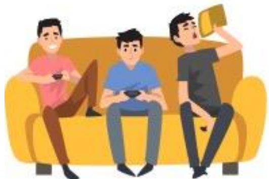
居住在同一户家庭