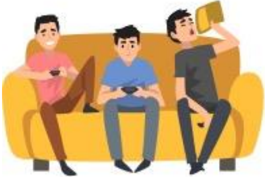
ஒரே வீட்டில் வசிப்பது