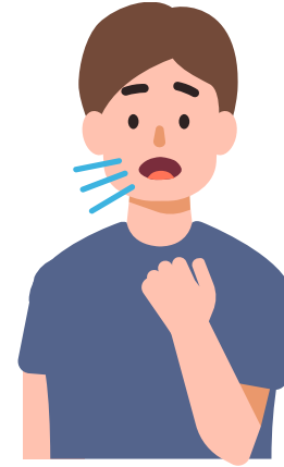
3 வாரங்கள் அல்லது அதற்கும் அதிகமாக இடைவிடாத இருமல்