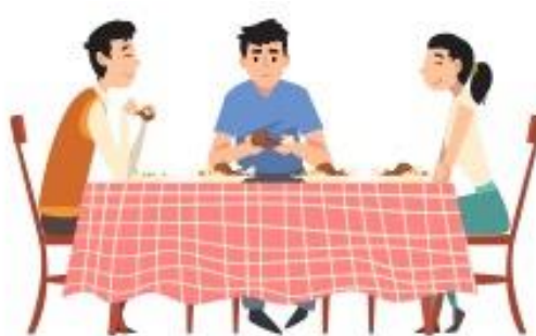
உணவு அல்லது பானத்தைப் பகிர்ந்துகொள்வது