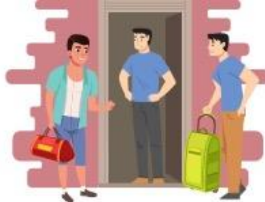
ஒரே அறையைப் பகிர்ந்துகொள்வது