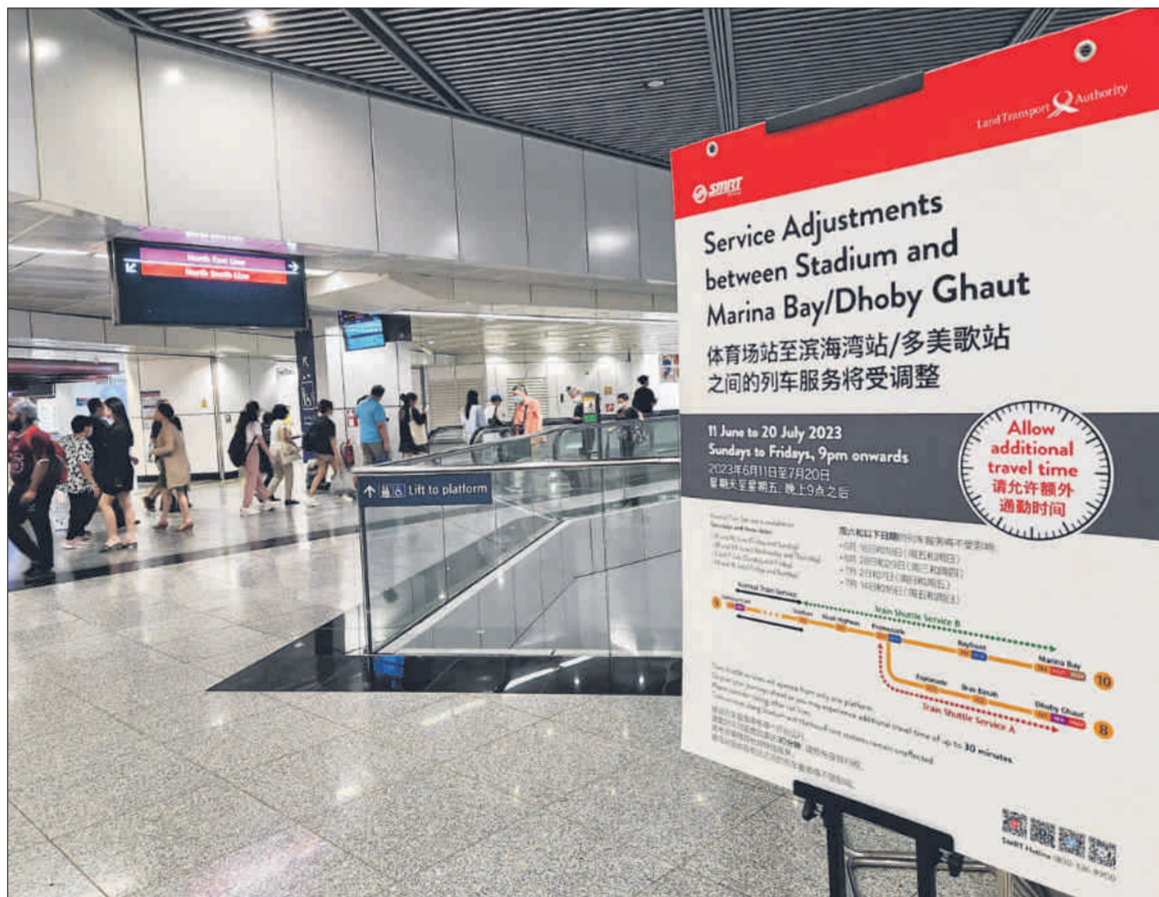
地铁环线的隧道维修工期原为五个半星期，但工程进度比预期快，只用了两星期左右就完成。图为多美歌地铁换乘站。

《联合早报》记者在服务受影响的首个晚上现场观察发现，七个地铁站内都设有明显告示和换乘建议。在宝门廊、海湾舫等乘客较多的换乘站，工作人员在站台疏导人潮，并向乘客建议换乘其他地铁线。